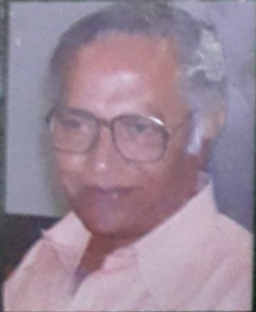
சண்முகசுந்தரத்தின் தோப்பில் ஒரு தனிமரம்