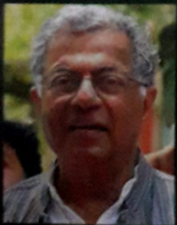
கிரீஷ் கர்னாடின் நாகமண்டலம் (நாடகம்)